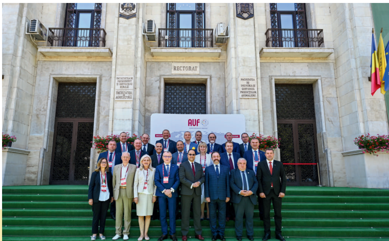
La réunion constitutive de la C2R-ECO, le 30 juin 2023 à Bucarest, Roumanie hébergée par l'Université de Sciences Agronomiques et de Médecine Vétérinaire de Bucarest

Constituée en juin 2023, la C2R-ECO a regroupé une vingtaine de recteurs des établissements membres de l'AUF-ECO, désignés par les Présidents des Conseils Nationaux des Recteurs de 11 pays de la région lors de la réunion constitutive.