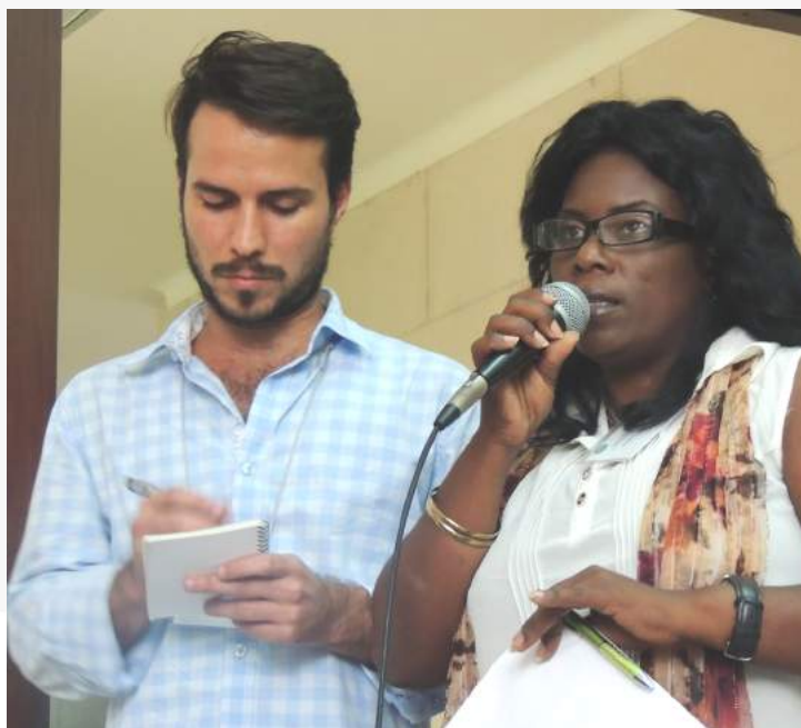
La Vice-Rectrice de l'Université de l'Orient et un boursier de l'Université de la Havane.

Je pense qu'en général l'opportunité a été très grande et très importante pour nous de participer à cette Assemblée générale de la CORPUCA. Cela nous a permis de dialoguer avec les collègues autour de ce qui se passe à travers nos universités respectives. Nous sommes très honorés que l'AUF ait pris l'initiative de nous inviter à ces assises. Il y a très longtemps que nous entretenons des rapports avec d'autres universités. Et maintenant, après cette réunion, je vais en parler avec le Recteur et le Président de mon université pour présenter un projet d'adhésion à l'AUF et à la CORPUCA. Cela nous permettra de formaliser des projets que nous entretenons avec d'autres universités de la région.