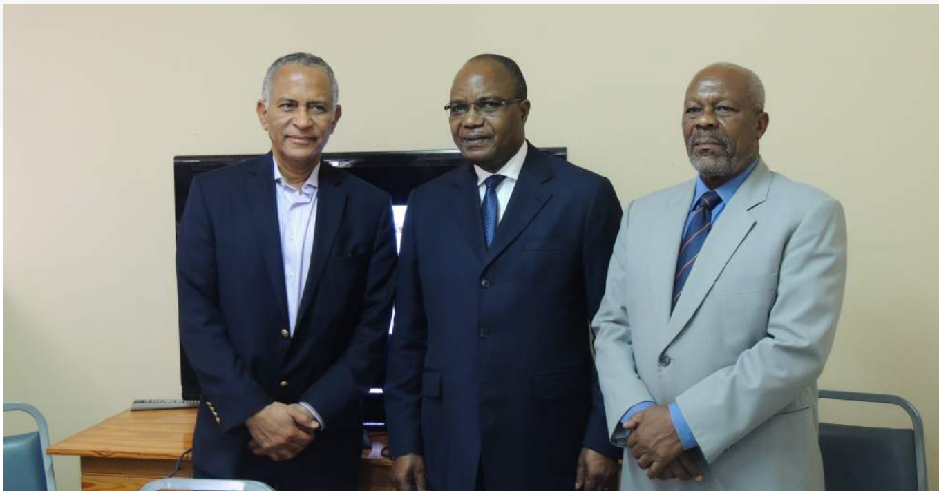
De la gauche vers la droite : les présidents de la CORPUHA, de la CRUFAOCI et de la CORPUHA