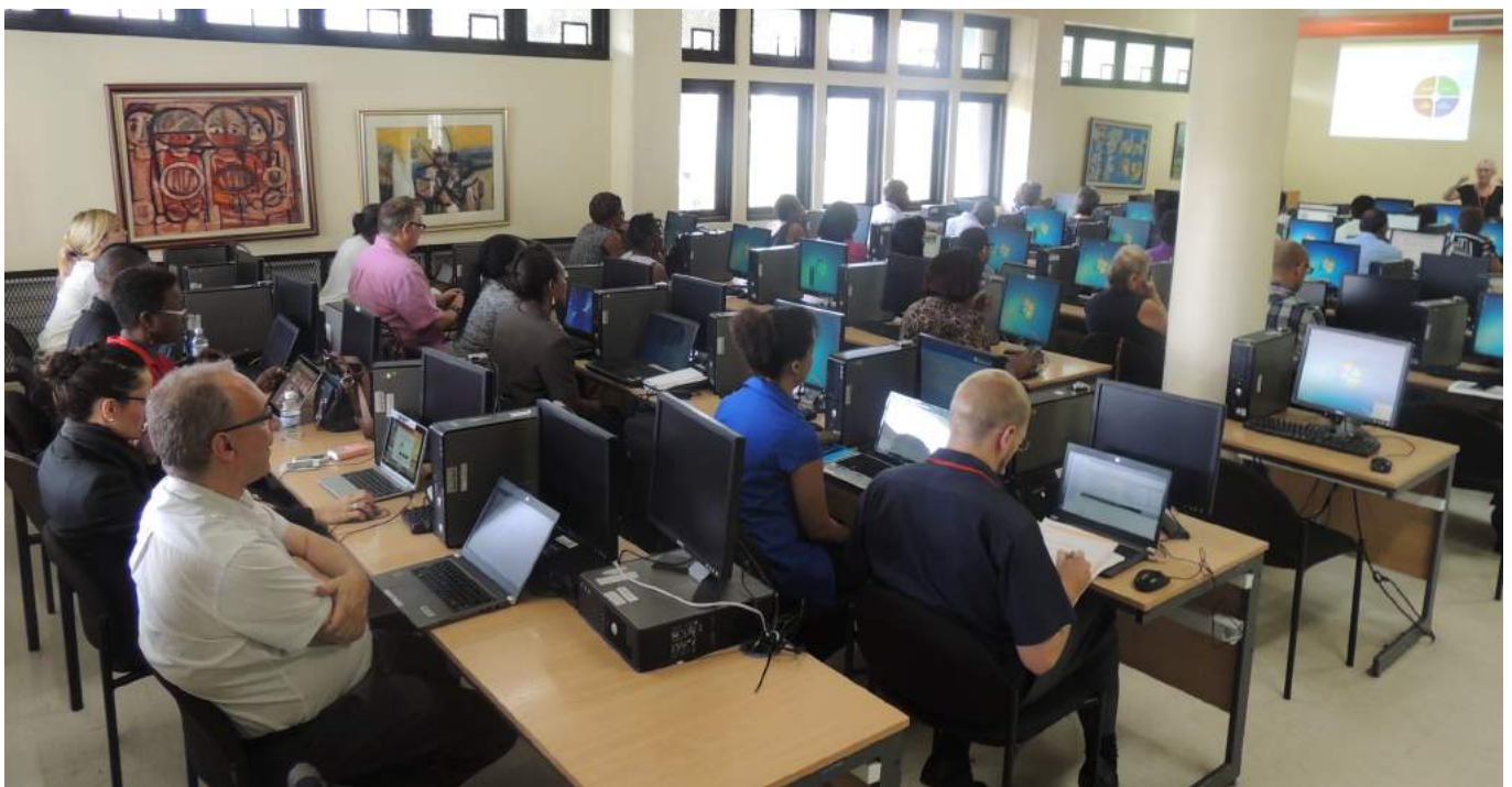
Atelier d'initiation à la problématique TICE et FLE.