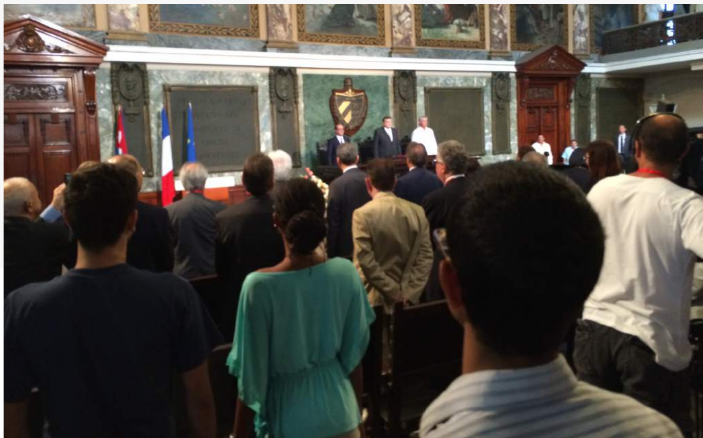
Accueil du Président de la République française, M. François Hollande, à la salle Aula Magna de l'Université de la Havane

La XII ème Assemblée Générale de la Conférence Régionale des Recteurs, des Présidents et des Directeurs d'institutions universitaires de la Caraïbe, membres de l'Agence universitaire de la Francophonie (CORPUCA) a eu lieu du 9 au 11 mai à La Havane (Cuba), lors du passage du Président de la République Française.